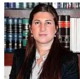
Esc. Agustina Pollini

Una vez cumplidos los requisitos exigidos por el artículo 18, se consigue lo que la LPVS denomina una “ Horizontalidad Definitiva ”, con prescindencia de la Habilitación Final Municipal. De esta manera, mediante la implementación de este nuevo régimen, se pretende establecer un mecanismo abreviado para el ingreso al régimen de propiedad horizontal.